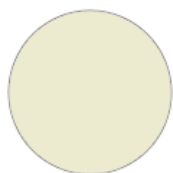
60250539 auf Bestellung